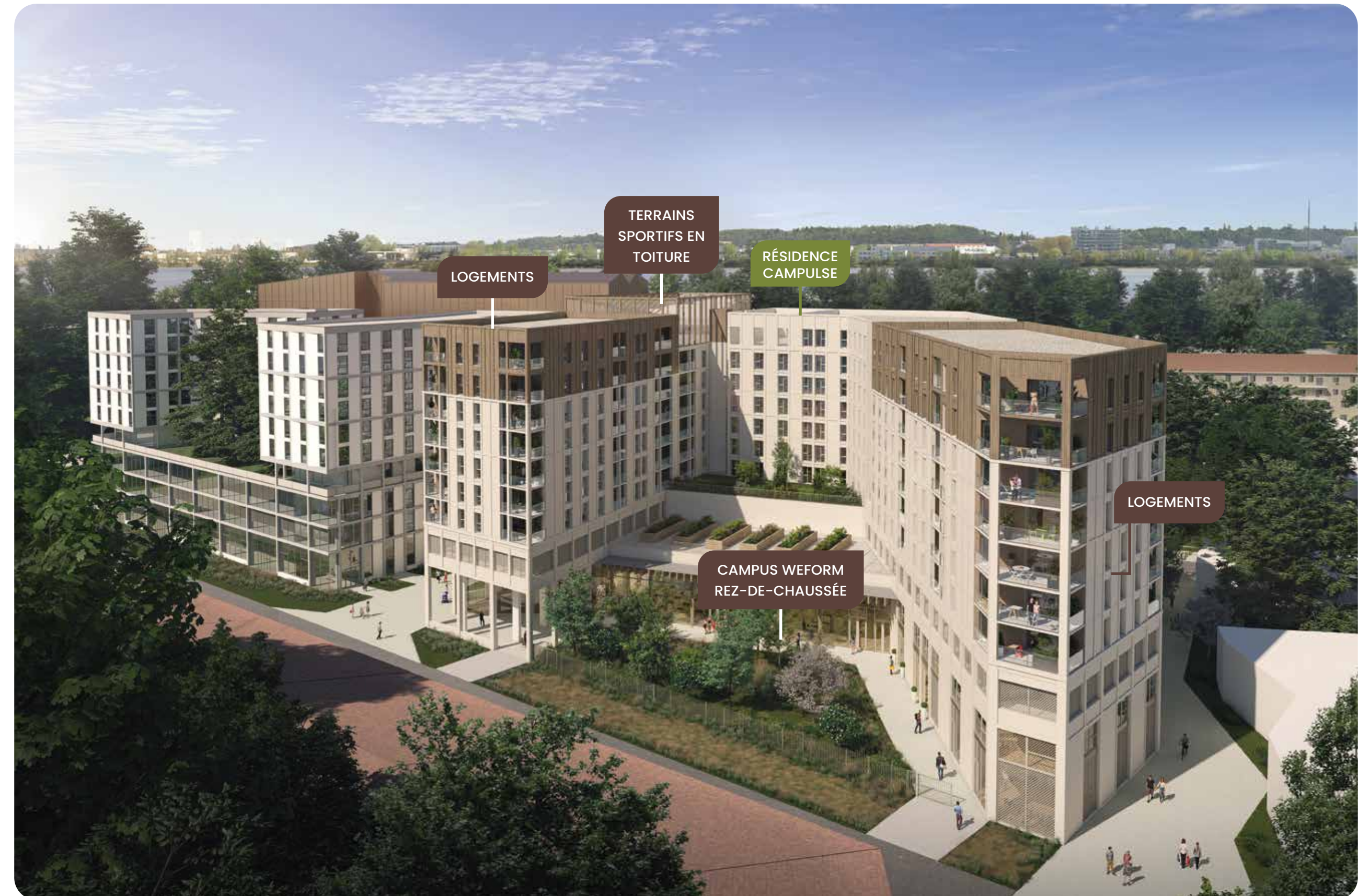
Vue globale du projet

À PROXIMITÉ DU JARDIN DE L'ARS, DE LA PLACE D'ARMAGNAC ET DES BERGES DE LA GARONNE.