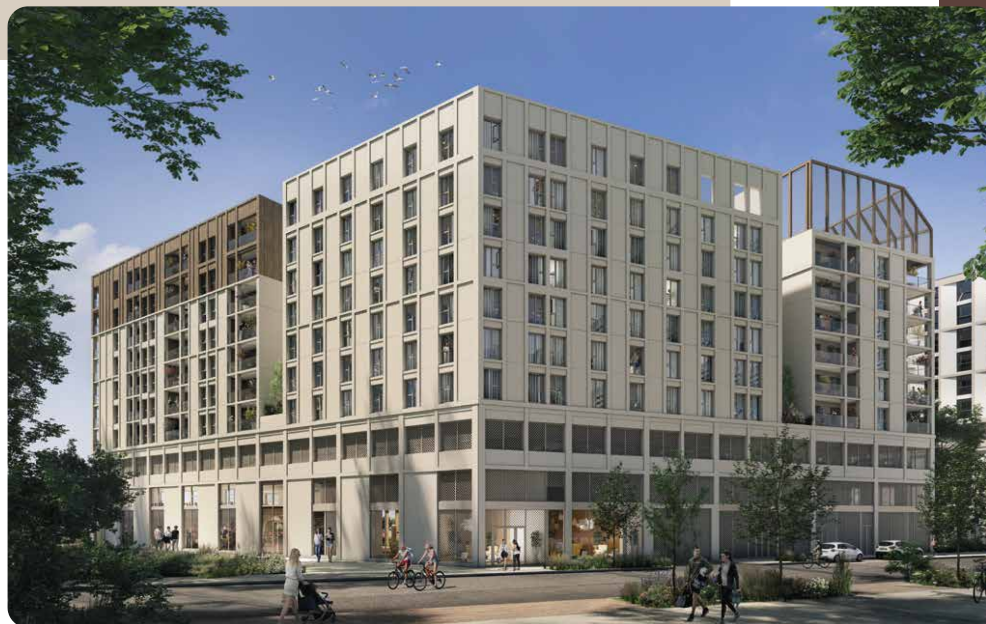
Vue de la résidence Campulse depuis l'angle de la rue de la Louisiane et de la nouvelle voie créée

Nichée non loin des jardins de l'Ars – 8 hectares de pleine nature reconquise à des friches industrielles – et à deux pas du futur pont Simone Veil, ce quartier s'inspire des grands paysages de la métropole et offre une nouvelle entrée au sud du centre-ville de Bordeaux. Le quartier dispose d'un large éventail de services et d'infrastructures, comprenant des hôtels, une bibliothèque et de nombreuses écoles, créant ainsi un environnement propice à la vie étudiante et à la culture.