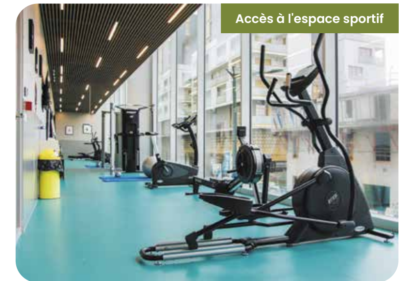
Accès à l'espace sportif