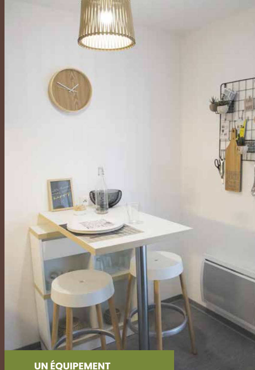
UN ÉQUIPEMENT FONCTIONNEL ET ADAPTÉ