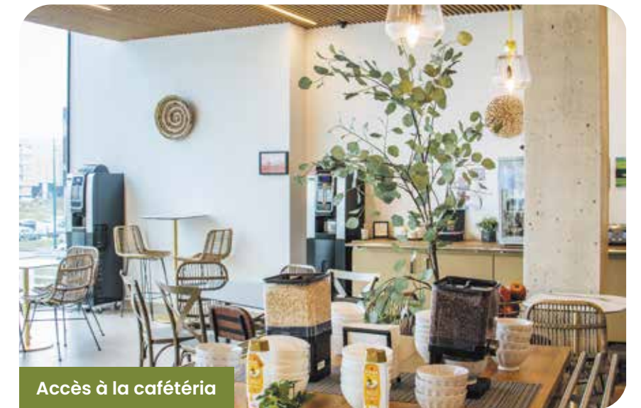
Accès à la cafétéria